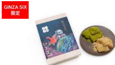
GINZA SIX 限定 銅釜直火炊き わらび餅 (日持ちタイプ) (きな粉・抹茶) GINZA 芭蕉堂 [B2F] 1,620円

「匠美」はうるち米に食感を残したもち米を練りこむことで風味豊かな歯触りとお米の旨味を楽しむことができ、化学調味料を使わない独自ブレンドの塩や醤油で味付けした甚五郎の息の詰まった珠玉の看板米菓。今回はヤノベケンジ氏のイラストをモチーフにしたスペシャルパッケージに包んでの登場です。パッケージの包装紙はブックカバーなどとしてお使いいただけます。