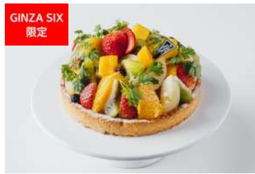
クリスマスタルト～グルテンフリー～ Viennoiserie JEAN FRANÇOIS[B2F] 3,780円

銀座マキシムの名作スイーツ“苺のミルフィーユ”が、当時の総支配人、初代パティシエ監修のもとに復活。ジューシーな苺をたっぷり使い、コアントローの香り漂うカスタードクリームとともに、サクサクのパイ生地です。