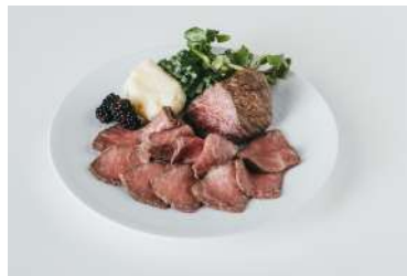
上州牛イチボローストビーフ 荻野屋[B2F] 6,000円

山口県「秋川牧園」の鶏肉を使用。香り高いバジル、オレガノ、セージとじっくりローストした、ジューシーで柔らかな丸どり。取り分けて残った身と骨は、スープやカレーに変身させてもいい。