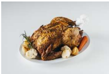
秋川牧園 3種のハーブ香る丸どり ビオセボン[B2F] 5,379円

山口県「秋川牧園」の鶏肉を使用。香り高いバジル、オレガノ、セージとじっくりローストした、ジューシーで柔らかな丸どり。取り分けて残った身と骨は、スープやカレーに変身させてもいい。