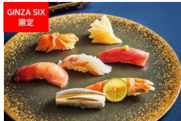
GINZA SIX 限定 商品名クリスマス特別コース つきじ鈴富 [13F] 54,450円 (サービス料込)

冬の味覚を贅沢に味わう、「牡蠣と鯛のしゃぶしゃぶコース」を1日2組限定で提供。旨味たっぷりの牡蠣と脂が乗った新鮮な鯛を、特製の出汁でしゃぶしゃぶしながら味わうひとときは、寒い季節ならではの至福の時間。