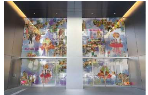
1F エントランス(中央通り正面7丁目側)

いつもの日常が特別な光を纏い、祝祭的な空間に変わるクリスマス。一説によると、古代ヨーロッパでは太陽が弱まり闇の支配が強くなるこの時期に、死者たちの霊がこの世を訪れたそうです。彼らを歓迎するために贈り物を用意した風習が、クリスマスの原型なのだから。今回のミッションは、僕にとっての「HEAVENLY GIFT」。幼少期にクリスマスの飾りつけで感じたドリーミーな高揚感に包まれながら臨みました。願わくば、このワクワクが皆さまにも届きますように！