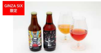
GINZA SIX 限定 (右)ベクタービア Euphoria Pink IPA (左)ベクタービア Serendipity Hazy IPA いまでや銀座 [B2F] 各880円

芭蕉堂で人気の銅釜直火炊きわらび餅。作り立てのみずみずしさをそのままにパックした、丹波黒豆きな粉と抹茶きな粉のお味のセットです。ヤノベケンジ氏とコラボレーションした限定パッケージは、日本の味をボーダレスに世界へお届けする想いを象徴しています。