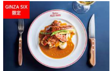
GINZA SIX 限定 オマール海老のロースト 濃厚なアメリカヌソース ビストロ オザミ [6F] 7,700円

「握りのおまかせ」に、天然とらふぐの薄造りや天然本鮪のシャトーブリアンをつけたコース。豊洲市場仲卸「鈴富」が旬の魚介を厳選し、熟練の寿司職人と和食の料理人が仕立てる極上の味をぜひ。