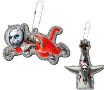
(上) SHIP'S CAT(Flying) / クリスマスオーナメント (下) LUCA 号 / クリスマスオーナメント 各 1,100 円(税込)