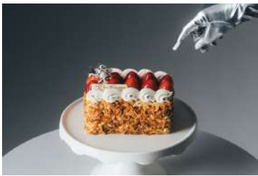
苺のミルフィーユ THE GRAND GINZA[13F] 7,000円