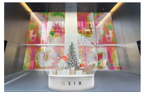
1F エントランス(中央通り正面4丁目側)