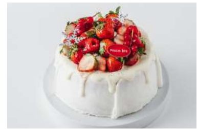
ストロベリーホワイトXmasシフォンケーキ MERCER bis GINZA[B2F] 6,800円

米粉を使用したサクサクのタルト生地の上に、上品な味わいのアーモンドクリームととろけるようなカスタードクリームを重ねて、色とりどりのフルーツをたっぷり。あっさりとした甘さで男性にも喜ばれます。