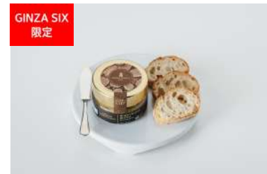
アロマトリュフバター AROMA TRUFFLE[B2F] 5,400円

こだわりの肥育環境や食事により育まれた、上州牛の希少なイチボを使用。肉本来の風味と深いコクが楽しめる逸品は、一口食べるごとに夢見心地な気分。お好みのワインと一緒にどうぞ。