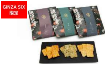
GINZA SIX 限定 匠美 (醤油、青のり、しお) 甚五郎 [B2F] 各650円

GINZA SIX B2Fの食物販店舗の一部に「BIG CAT BANG」コラボレーション商品が登場します。ヤノベケンジが描き下ろしたイラストをはじめ、「SHIP'S CAT」をモチーフにした、GINZA SIXでしか手に入らないアートな手土産などが揃います。