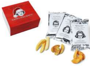
GIFT BOX MINI 6PACKS AND THE FRIET [B2F] 2,100円

ホリデーシーズンの手土産は、今だけ楽しめるおいしさと一緒に、クリスマスならではのワクワク感をお届けします。