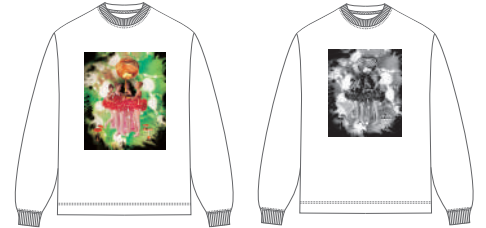
HEAVENLY GIFT T シャツ 各 6,600 円(予定価格)