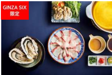
GINZA SIX 限定 牡蠣と鯛のしゃぶしゃぶコース 魚とごはん 黒座椿亭 [6F] 11,000円 [1日2組限定]

大切な人と一緒に楽しむ、GINZA SIX限定の特別メニューやクリスマスコースが勢揃い。