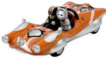
SHIP'S CAT(Speeder) /プルバックカー 4,400 円(予定価格)