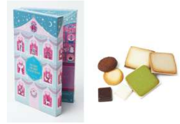
メリーメリーカレンダー ISHIYA G [B2F] 2,700円

「G7広島サミット 2023」で各国首脳に提供された 焼き菓子と、2024年の日米首脳会談の際に、お みやげに採用された沖縄産コーヒー豆のセット。