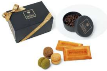
ラグジュアリーボックス コーヒータイムB 2023 Bicerin [B2F] 18,360円

ダブルトリュフソフトやバルサミコ アンド ペッパー、 チェダーチーズなど、6種類のドライフリットをクリ スマス限定のパッケージに詰め合わせ。