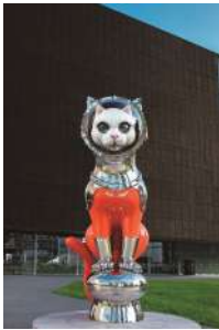
SHIP'S CAT (Muse) (2021)

1965年、大阪生まれ。1990年代初頭より、「現代社会におけるサヴァイヴアル」をテーマに機能性を持つ大型機械彫刻を制作。ユーモラスな形態に社会的メッセージを込めた作品群は国内外から評価が高い。2017年、「船乗り猫」をモチーフにした、旅の守り神「SHIP'S CAT」シリーズを制作開始。2022年に開館した大阪中之島美術館のシンボルとして「SHIP'S CAT (Muse) (2021)」が恒久設置される。