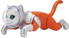
SHIP'S CAT (Flying) Figure mascot