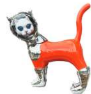
SHIP'S CAT (ONK-1)