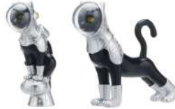
カプセルトイ AIP SHIP'S CAT Ver1.5