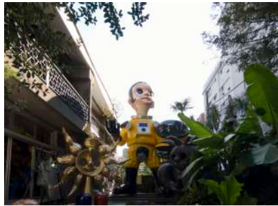
Sun Child No.1 (2011)

2022年に開館した大阪中之島美術館のために制作された「SHIP'S CAT」シリーズの彫刻作品。