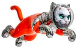
SHIP'S CAT (Flying)

「SHIP'S CAT」とは、大航海時代に長い航海に乗船した「船乗り猫」のこと。宇宙を航海する未来の希望を予兆し、安全や出会いを助ける守り神となって、混迷する世界においても、人々や若者の旅を導いて欲しいという願いが込められています。