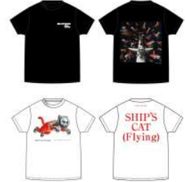
SHIP'S CAT T-shirt

SHIP'S CATをモチーフにしたミニサイズフィギュア。小さいながら細かい部分まで再現しています。※ブラインドカプセルでの販売となります。