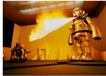
Giant Torayan (2005)

右手に持つ「太陽」は、岡本太郎の「太陽」をテーマにした作品群から魂とデザインを受け継いでいる。