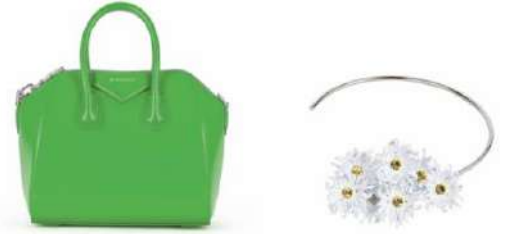
左から、アンティゴナ バッグ ¥256,300、 デイジーモチーフネックレス ¥158,400 どちらも GINZA SIX 限定商品