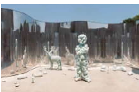
collection of Benesse Holdings, Inc.

音楽プロデューサー小林武史が発起した「Reborn-Art Festival」で、石巻の牡鹿半島に展示された彫刻。震災復興のシンボルとして恒久設置となった。