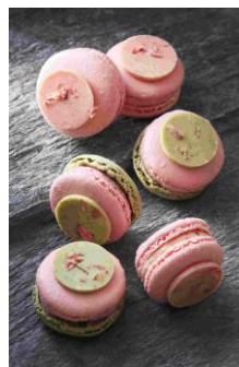
PALETAS [B2F] Macaron Sa_ku_ra