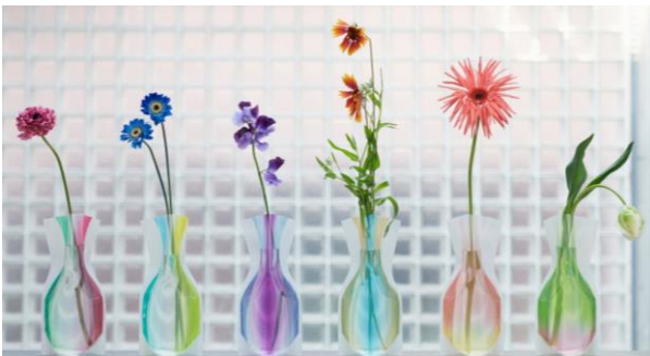
D-BROS [4F] フラワーベース