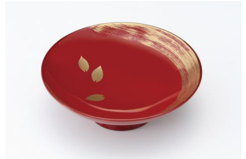
漆器 山田平安堂 [4F] 桜盃