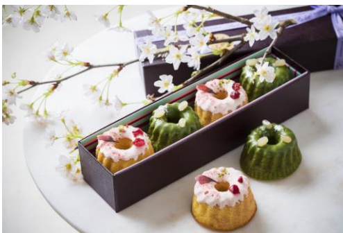
パティスリー パブロフ [B2F] クグロフ 桜&抹茶