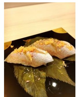
つきじ鈴富 [13F] 春子鯛の桜葉漬