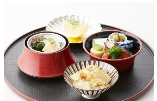
旬彩三山 [B2F] 筍ご飯と鼓弁当