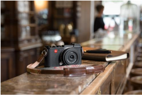
Leica Store [5F] ライカ CL