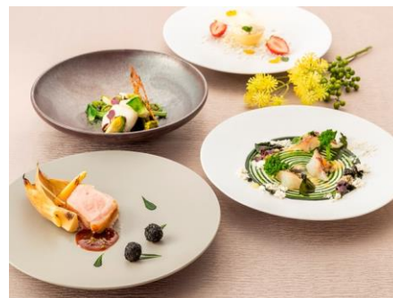
THE GRAND GINZA [13F] 春の味覚×四国エリアの食材を使った 新感覚フレンチ