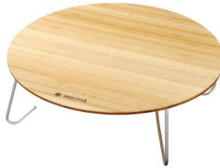
snow peak MOBILE [5F] ワンアクション ちゃぶ台 竹 M