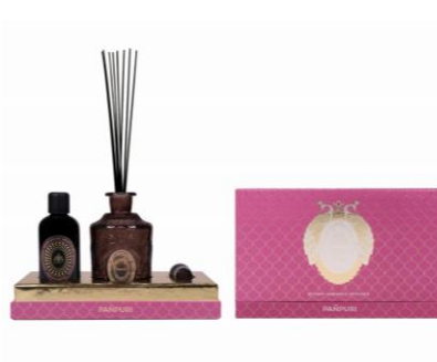
PANPURI [B1F] ディスタントショアーズ ミニ ディフューザーセット