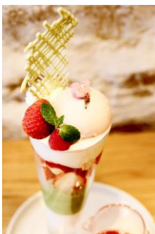
72 Degrees Juicery + Café by David Myers [5F] 桜と抹茶の彩りパフェ