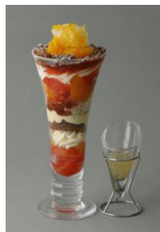
PHILIPPE CONTICINI [B2F] ヴェリーヌパフェ アグリウム ジャンジャンブル柚子